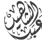
Shahid Law Firm